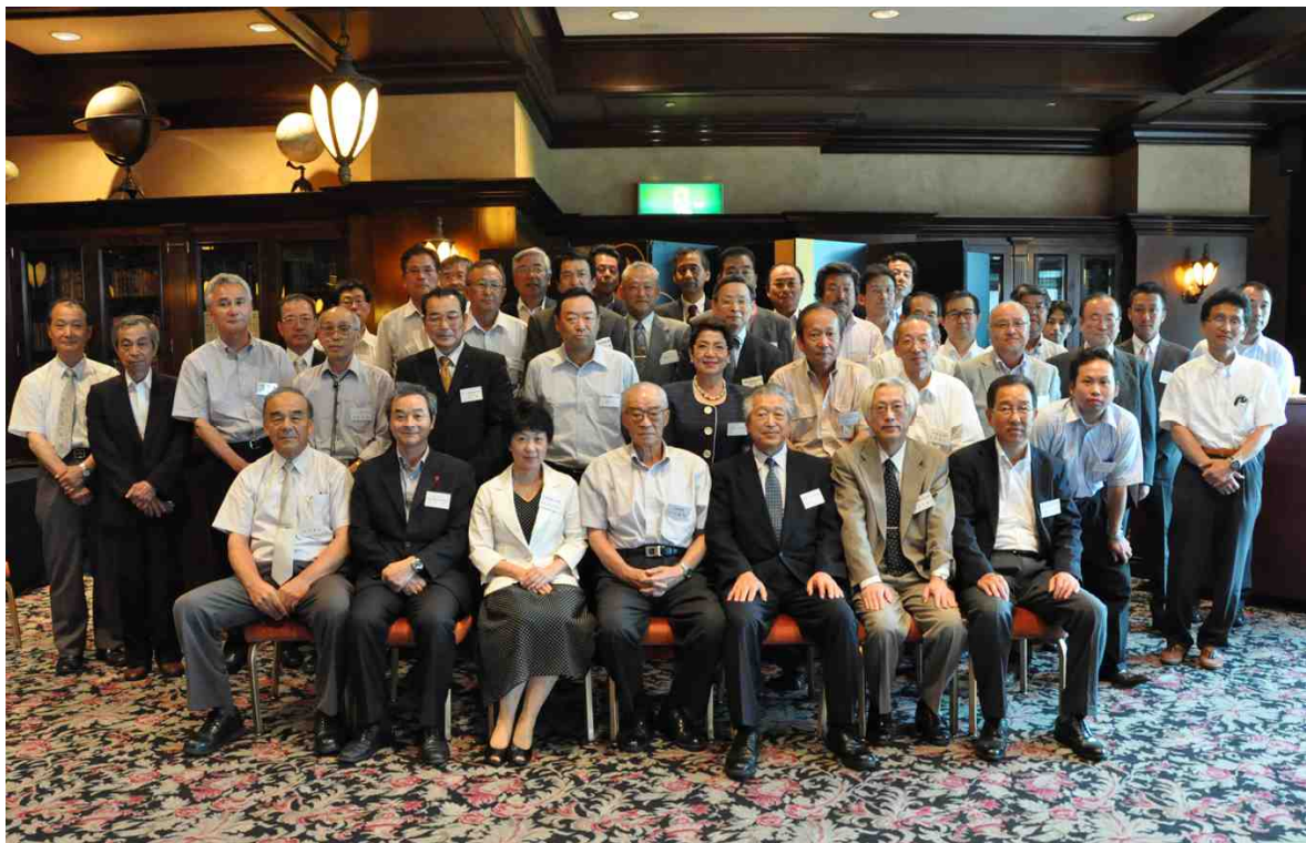
30周年記念式典 【平成23年(2011)7月8日 ホテル ザ・マンハッタン】