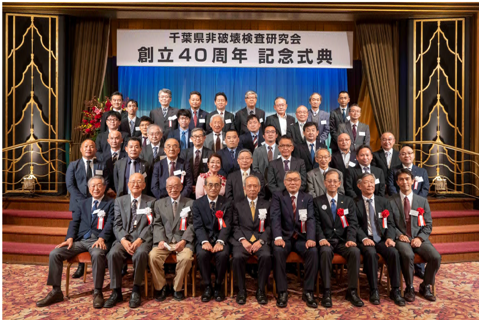
【創立40周年記念式典 令和4年(2022年)11月10日 ホテル ザ・マンハッタン】